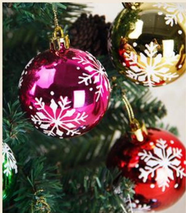
МАСТЕР-КЛАСС "НОВОГОДНИЕ РАСПРОДАЖИ"