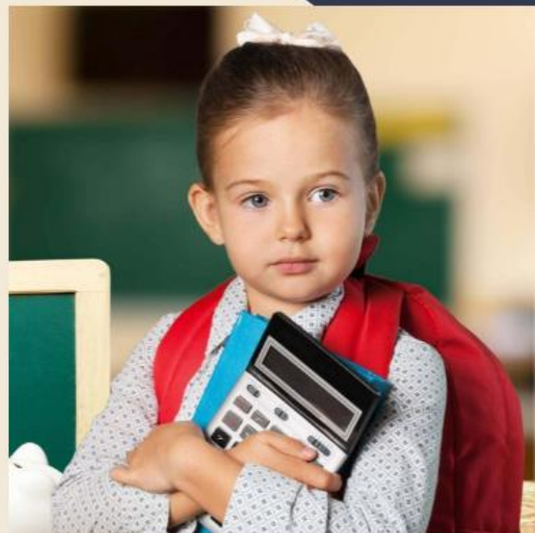
ДОЛГОСРОЧНЫЙ ПРОЕКТ/ ПАРЦИАЛЬНАЯ ПРОГРАММА