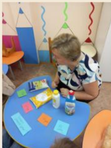
БЮДЖЕТ (НА ПРИМЕРЕ БЮДЖЕТА СЕМЬИ)