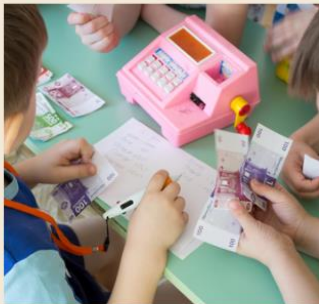
КРАТКОСРОЧНЫЙ ОБРАЗОВАТЕЛЬНЫЙ ПРОЕКТ