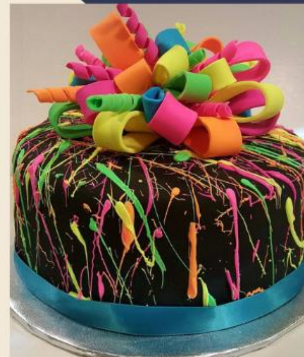
МАСТЕР-КЛАСС "ТОРТ НА ДЕНЬ РОЖДЕНИЯ"