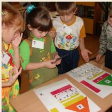
ЗАНЯТИЯ ПО МАТЕМАТИКЕ