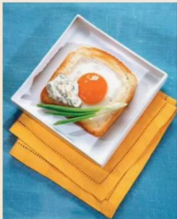
МАСТЕР-КЛАСС "ЗАВТРАК ДЛЯ МАМЫ"