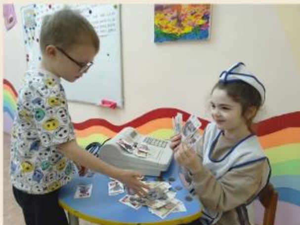
ЗНАКОМСТВО С ПРОФЕССИЯМИ