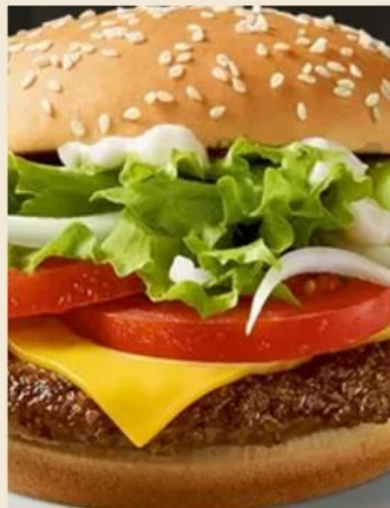
МАСТЕР-КЛАСС "ПРАВИЛЬНЫЙ ПЕРЕКУС"