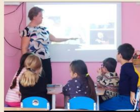
ТРУД И ПРОДУКТ ТРУДА (ТОВАР)