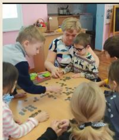
ДЕНЬГИ И ЦЕНА (СТОИМОСТЬ)